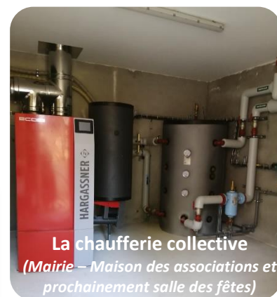
La chaufferie collective (Mairie – Maison des associations et prochainement salle des fêtes)

Réhabilitation des anciennes écoles en maison des associations et création d'une chaufferie collective granulés bois.