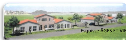
Esquisse ÂGES ET VIE

Projet de réalisation de deux colocations destinées aux personnes âgées handicapées ou en perte d'autonomie avec logements dédiés aux auxiliaires de vie travaillant au service des colocataires – Route de Marmande.