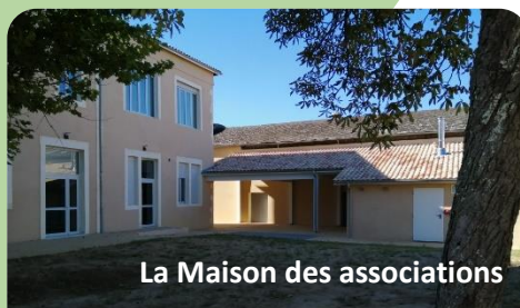
La Maison des associations